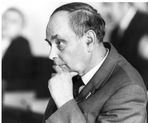
Директор ЛНФ (1957–1990 гг.) лауреат Нобелевской премии академик АН СССР И.М.Франк

Преимущества импульсного реактора в сравнении с механическими селекторами, применяемыми в то время на стационарных реакторах, были ясны с самого начала: намного экономичнее заставить пульсировать мощность реактора вместо отсекаания нейтронного пучка прерывателем. Именно так позже Д.И.Блохинцев пояснил намерение разработчиков ИБРа.