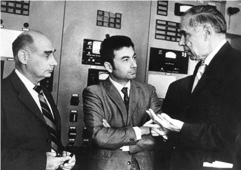
Г.Н.Флёров, Ю.Ц.Оганесян, Г.Т.Сиборг в ЛЯР ОИЯИ