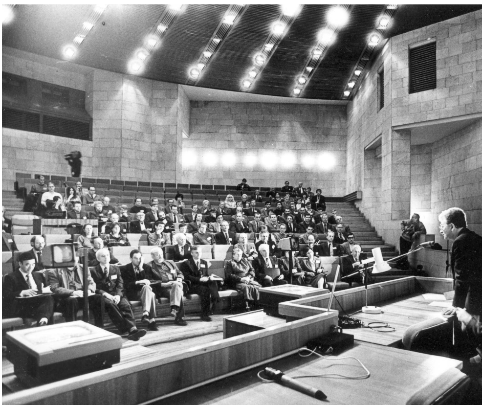
Международная конференция по динамике столкновения ядер при низких энергиях, Санкт-Петербург, 1995 г.