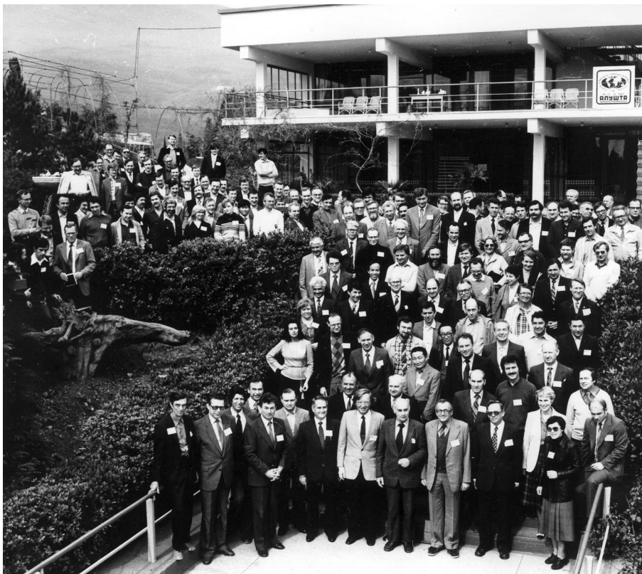
Международная школа-семинар по физике тяжелых ионов, Алушта, 1983 г.