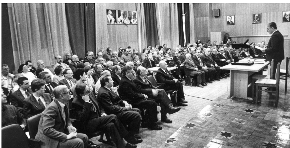
Международный семинар в ЛЯР