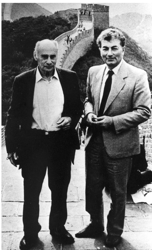
Г.Н.Флёров и Ю.С.Оганесян во время посещения КНР