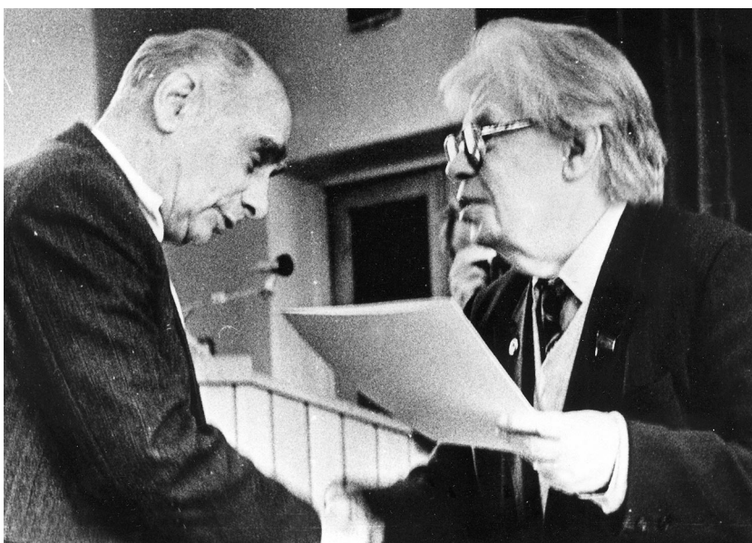
Н.Н.Боголюбов вручает премию ОИЯИ Г.Н.Флёрову